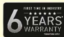
इंडस्ट्री में पहली बार 6 साल की वारंटी