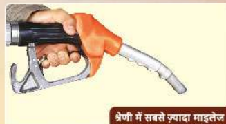
श्रेणी में सबसे ज्यादा माइलेज