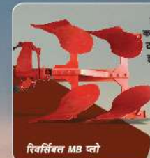
रिवर्सिबल MB प्लो