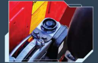
(575, 585 లో అందుబాటులో ఉంది)

- సులభంగా ఇంప్లిమెంట్‌ని పైకి లేదా కిందకు తీసుకురండి