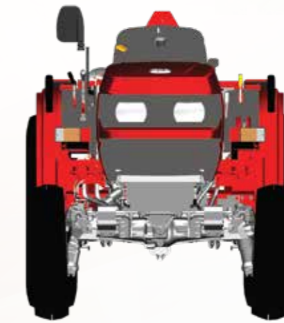
ट्रैक की कम चौड़ाई