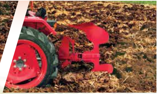
1 MB रिवर्सिबल प्लॉ को आराम से खींचे