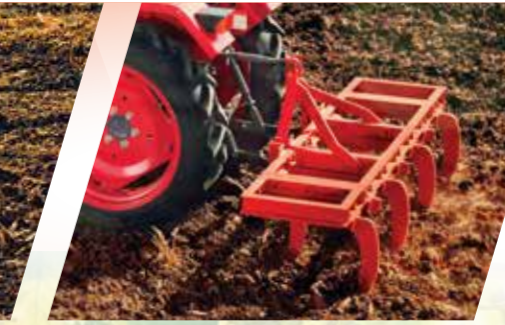
7 टाइप कल्टीवेटर के साथ काम करने की क्षमता