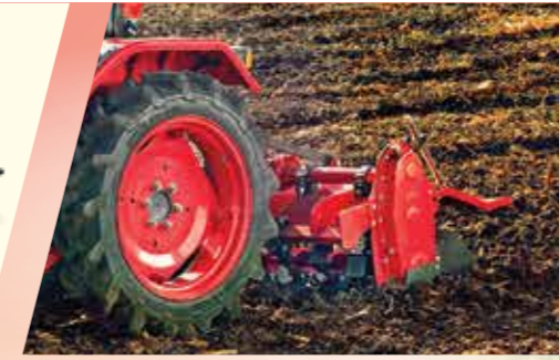
कम RPM ड्रॉपल महिंद्रा के 1.2 m रोटावेटर के साथ