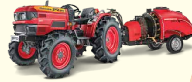
हर तरह के स्पेयर्स के साथ बेहतरीन परफॉर्मेंस

लो रेटेड RPM देता है कम कंपन और इंजन की लंबी उम्र, ईंधन की बेहतर बचत के साथ