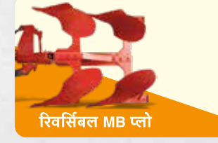
रिवर्सिबल MB प्लो