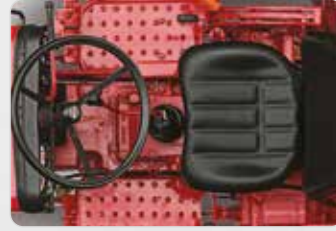
टफ़ काम में भी ज़्यादा आराम