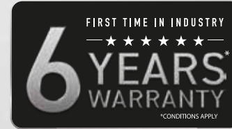
इंडस्ट्री में पहली बार 6 साल की वारंटी