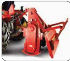
0.8 m रोटावेटर