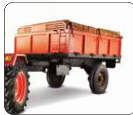
1.5 टन ट्रॉली