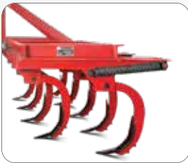
5 टाइन कल्टीवेटर