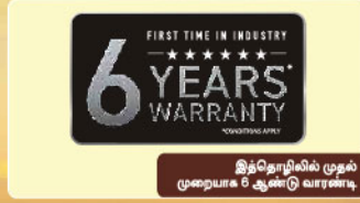
இத்தொழிலில் முதல் முறையாக 6 ஆண்டு வாரண்டி