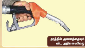
தரத்தில் அனைத்துமே விட அதிக வாய்வு