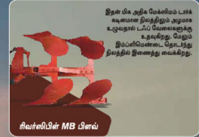
ரிவர்ஸிபிள் MB பிளஸ்