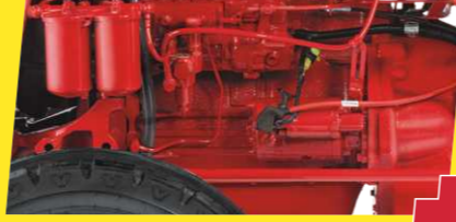
પાવરમાં PLUS - વધુ પાવર