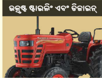
ଉତ୍କୃଷ୍ଟ ଷ୍ଟାଇଲିଂ ଏବଂ ଡିଜାଇନ୍

*ସର୍ବ ଓ ନିୟମାବଳୀ: ଟ୍ରିପଲ୍ ଟର୍କ୍ସ ବର୍ଣ୍ଣାୟାକ୍ଷିତ ଏବଂ ଟ୍ରିପଲ୍ ସମୟ-ସମୟରେ ପ୍ରାଥମିକ ବା ପରିବର୍ତ୍ତନ ହୋଇପାରେ।