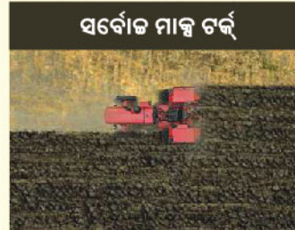
ସର୍ବୋତ୍ତମ ମାନ୍ୟ ଟର୍କ୍