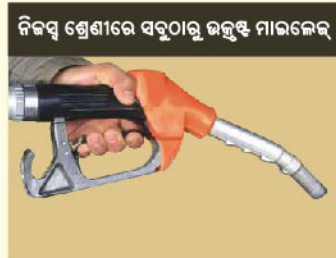
ନିଜସ୍ୱ ଶ୍ରେଣୀରେ ସବୁଠାରୁ ଉତ୍କୃଷ୍ଟ ମାଲକେଜ୍