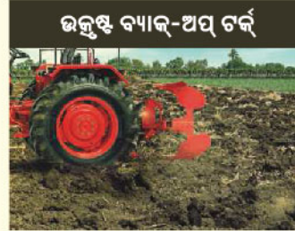
ଉତ୍କୃଷ୍ଟ ବ୍ୟାଲ୍-ଅପ୍ ଟର୍କ୍