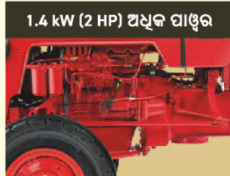
1.4 kW (2 HP) ଅଧିକ ପାୱର