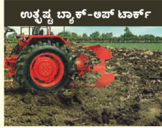
ಉತ್ಪನ್ನ ಬ್ಯಾಕ್-ಅಪ್ ಟಾರ್ಕ್