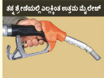
ತನ್ನ ಶ್ರೇಣಿಯಲ್ಲಿ ಎಲ್ಲಕ್ಕಿಂತ ಉತ್ತಮ ಮೈಲೇಜ್