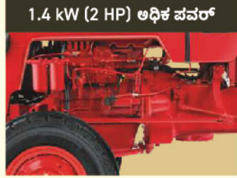
1.4 kW (2 HP) ಅಧಿಕ ಪವರ್