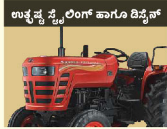
ಉತ್ಪನ್ನ ಸ್ಟೇಲಿಂಗ್ ಹಾಗೂ ಡಿಸೈನ್

*ನಿಬಂಧನ ಹಾಗೂ ಷರತ್ತುಗಳು : ಜಾಹೀರಾತಿನಲ್ಲಿ ತೋರಿಸಿರುವ ಆಯ್ಕೆಗಳಿಗೆ ಮತ್ತು ಚಿತ್ರಗಳು ಭಿನ್ನವಾಗಿರಬಹುದು ಮತ್ತು ಕಾಲಕಾಲಕ್ಕೆ ಬದಲಾಗಬಹುದು