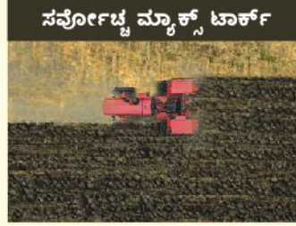
ಸರ್ವೋಚ್ಚ ಮ್ಯಾಕ್ಸ್ ಟಾರ್ಕ್