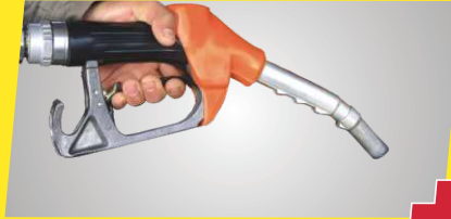
మెలేజ్లో PLUS - తన శ్రేణిలో అత్యుత్తమమైనది