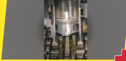
PLUS DI ఇంజన్ - ఎక్స్ట్రా లాంగ్ స్ట్రోక్ ఇంజన్