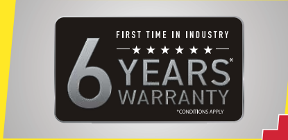
వారంటీలో PLUS- ఇండస్ట్రీలో మొట్టమొదటి సారిగా 6 సంవత్సరాల వారంటీ*