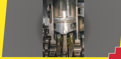
PLUS DI इंजन-एक्स्ट्रा लॉग स्टोक इंजन