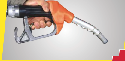
माइलेज में PLUS - श्रेणी में ईंधन की सबसे ज्यादा बचत