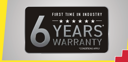
वॉरंटी में PLUS- इंडस्ट्री में पहली बार 6 साल की वॉरंटी*