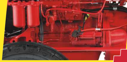
पावर में PLUS - ज्यादा पावर