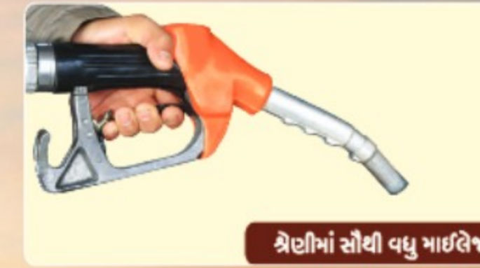
શ્રેણીમાં સૌથી વધુ માઇલેજ